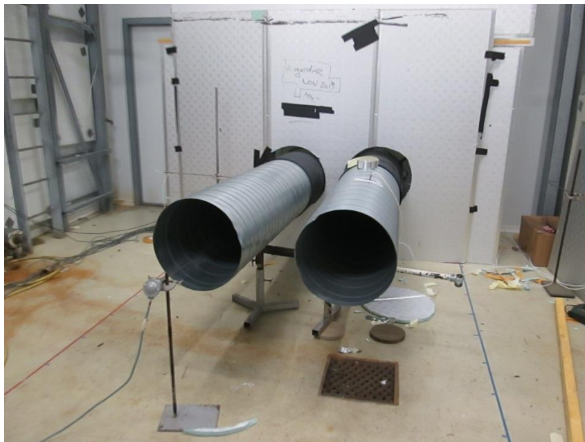
Vue générale de l'installation d'essai, côté extérieur