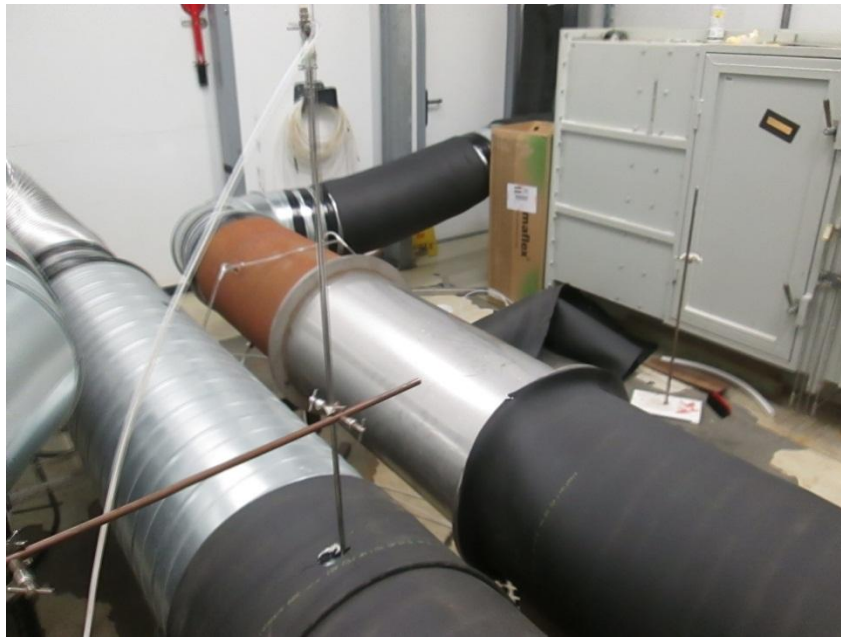
Vue générale de l'installation d'essai, côté intérieur

La centrale double flux testée était placée dans la chambre climatique régulant les conditions d'air extrait.